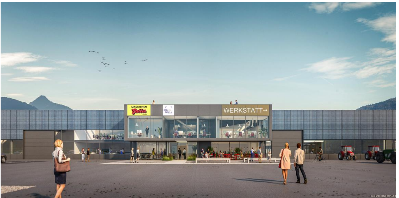
Vista dell'ingresso principale