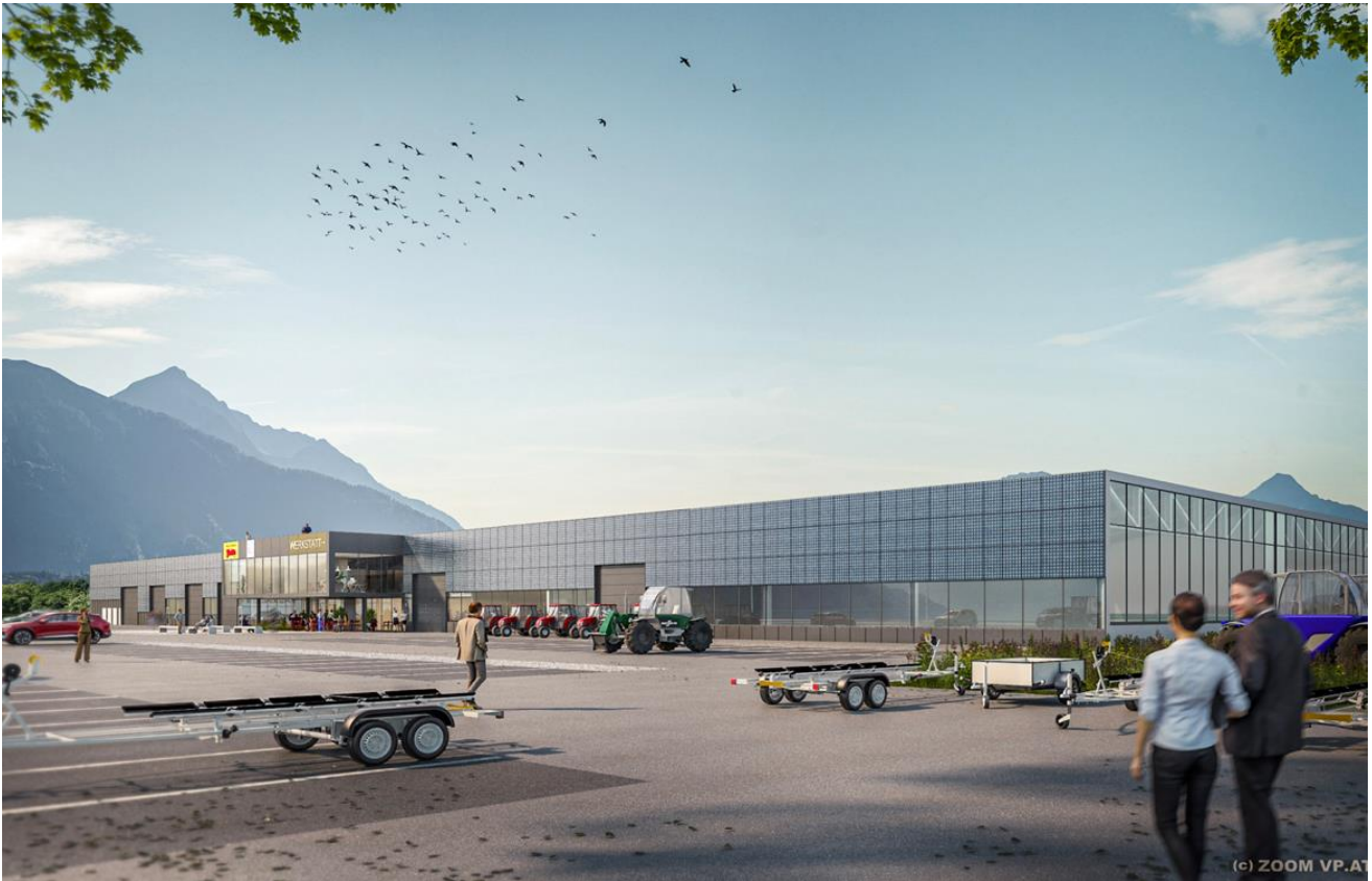
Ansicht von Nord-Osten